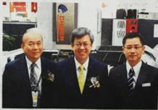
●慶鴻機電於2017台北國際工具機展南港展覽館4F M0810大秀創新實力，受副總統陳建仁（中）肯定。

航太產業蓬勃發展，慶鴻開發「AMS高速深孔加工機-AD系列」，以達成航太產業對於特殊材質加工、特殊多角度加工等高階技術機種，可應用於渦輪葉片、燃燒室、渦輪盤、噴嘴導葉、高壓渦輪殼、機匣、扣件等加工需求，並滿足航太客戶所需之刁鑽外型等中高階零件加工需求。此次展覽更推出全新多用途深孔放電加工機AD4LT，佔地空間小且具備單機與多機運行的加工能力，具備完整的自動化整合能力。