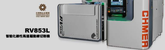
RV853L 智能化線性馬達驅動線切割機