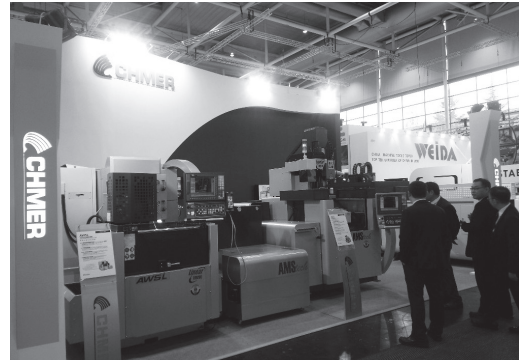
圖3、圖4 慶鴻機電於EMO展以CHMER、AMS雙品牌精密設備大秀創新實力。