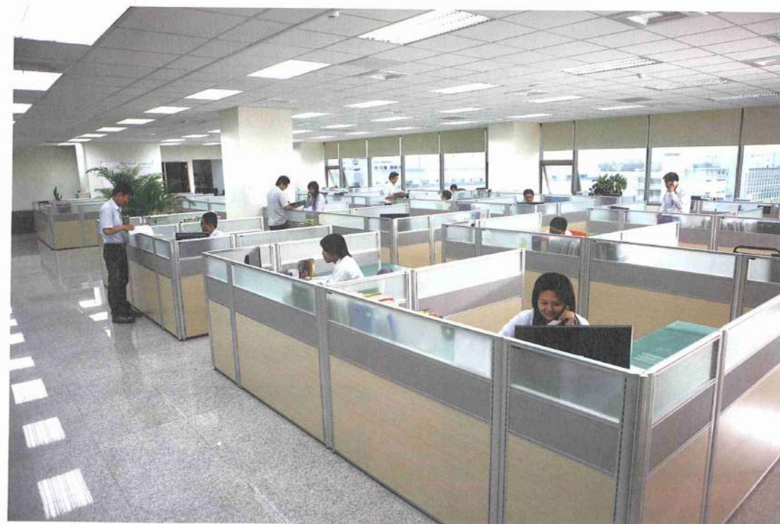
■慶鴻機電積極培養優秀人才，更利用獎勵措施鼓勵員工打拼。

慶鴻的財務公開且透明，每3個月發一次績效獎金。在每季的稅前毛利及每年稅後盈餘都提撥固定百分筆作為員工季獎金及年終獎金，員工創造的價值越高，分享就越多。「有些認真打拼且績效好的幹部，年收入結