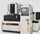
E0530L 龍門型線性馬達線切割機