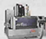
AW25L AMS高品質線性馬達線切割機