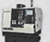
HM-430L 龍門型線性馬達高階加工機