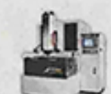
A60-40L 高性能三軸線性馬達放電加工機