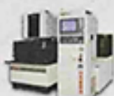
EX360L 高性能線性馬達線切割機