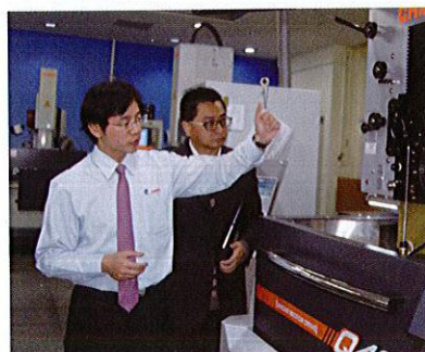
工作人员介绍庆鸿产品

年，通过ISO 9002认证；2001年，庆鸿推出精密龙门型浸水式线切割机及粉末CNC放电加工机；2013年，庆鸿高精度龙门型线切割机“Q4025L”荣获中小企业创新研究奖。