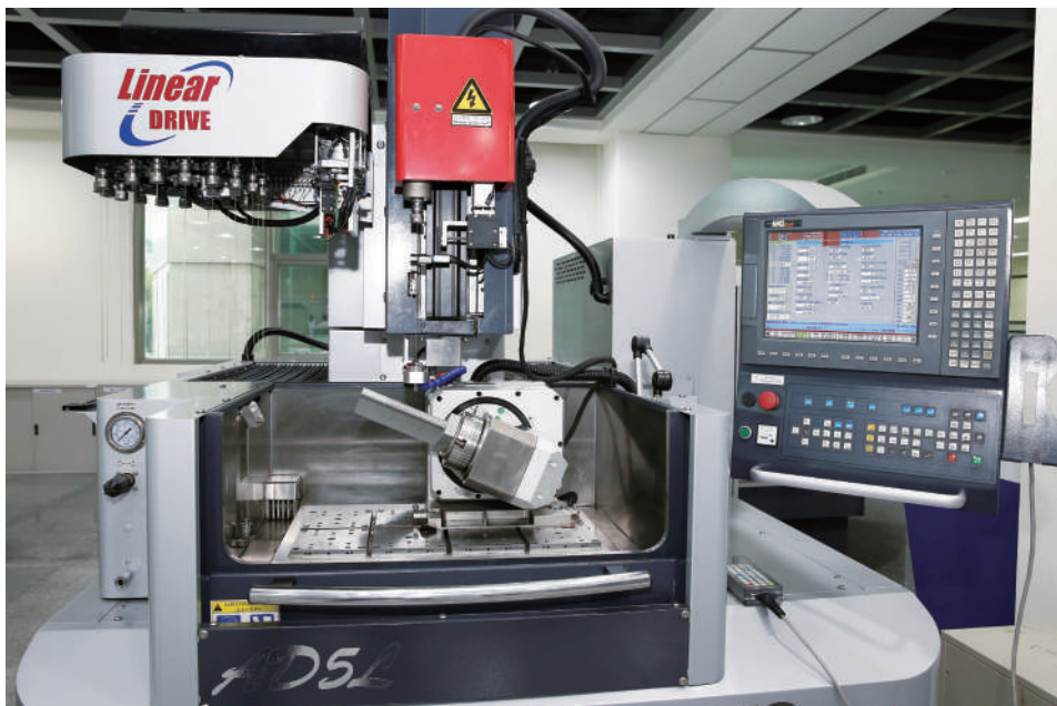
AMS高速深孔加工機可在鈦合金等複雜中高階零件的曲面上進行高效率穿孔、擴孔，以降低引擎葉片在運轉時溫度，滿足航太業所需。

布局10年以上，在全球市場上採取CHMER、AMS雙品牌分進合擊策略，期以專業多元的形象，滿足波音、空巴、GE對各區域市場Tier1供應商的客製化需求；台灣的漢翔、長榮航空、晟田等，也都是慶鴻老客戶之一，未來若能落實國機國造政策，可望創造越來越多機會。