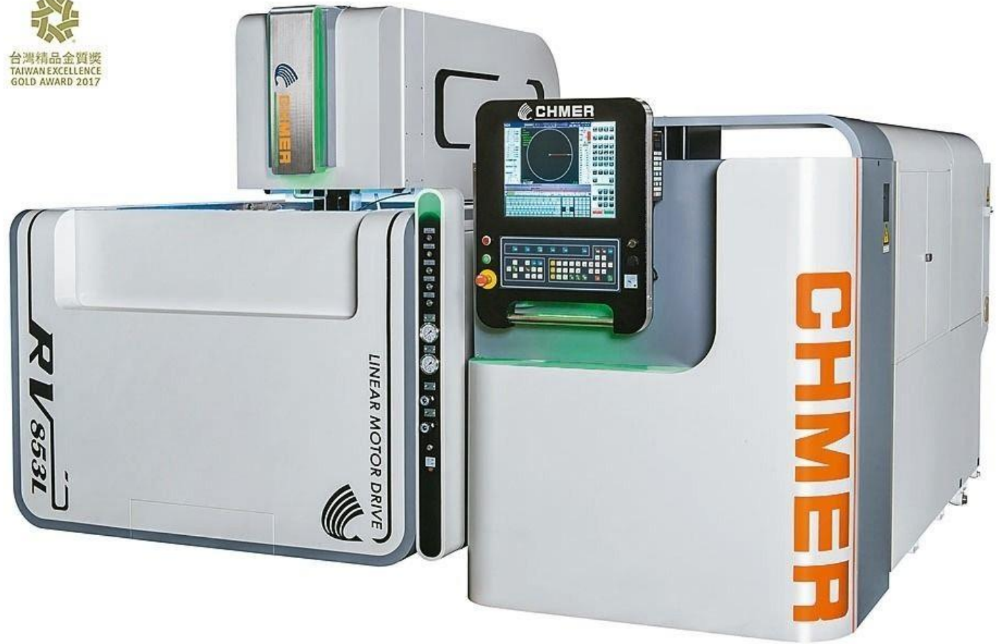
慶鴻 RV853L 智能化線性馬達驅動線切割機，滿足智慧製造，航太產業加工利器。