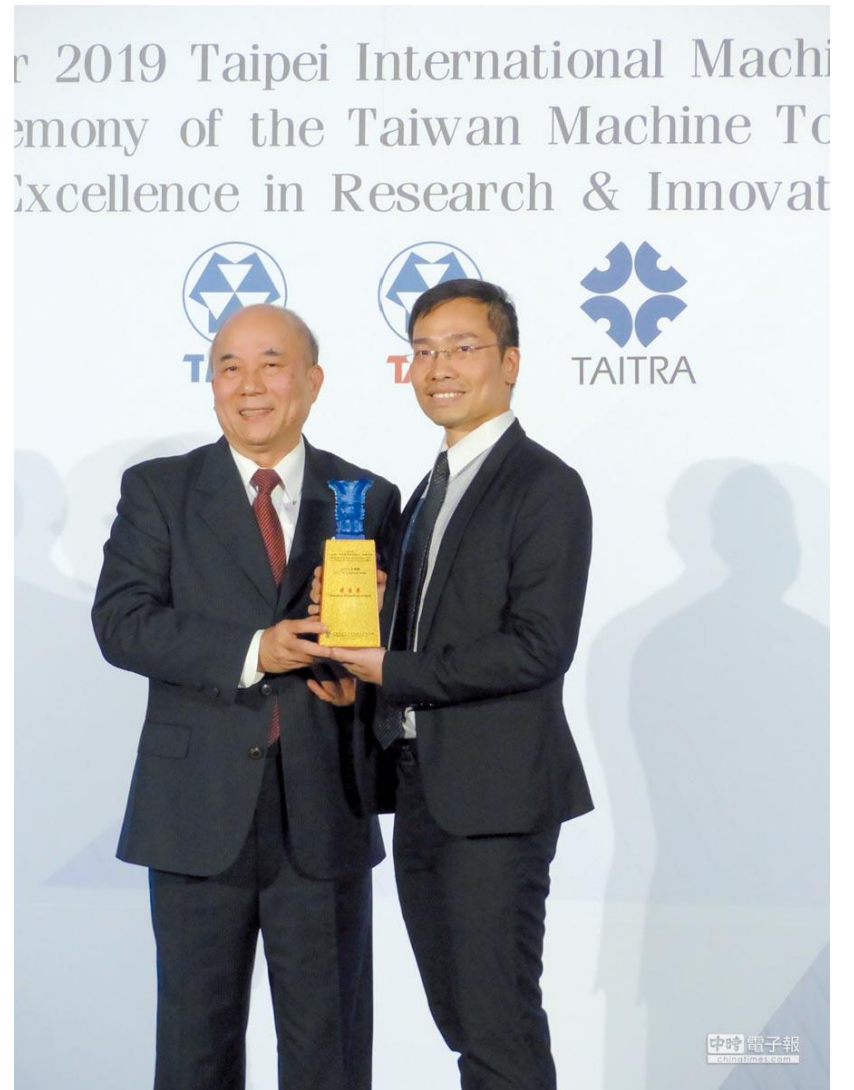
2019 工具機新產品研發競賽揭曉，慶鴻公司勇奪特優獎，由臺灣機械公會理事長柯拔希（左）親自頒獎。

另外，因應智慧製造時代來臨，今年首度增加的智慧工具機或零組件特別獎，則由永進機械的NFX800B-MPS多軸化智慧彈性製造單元奪得。