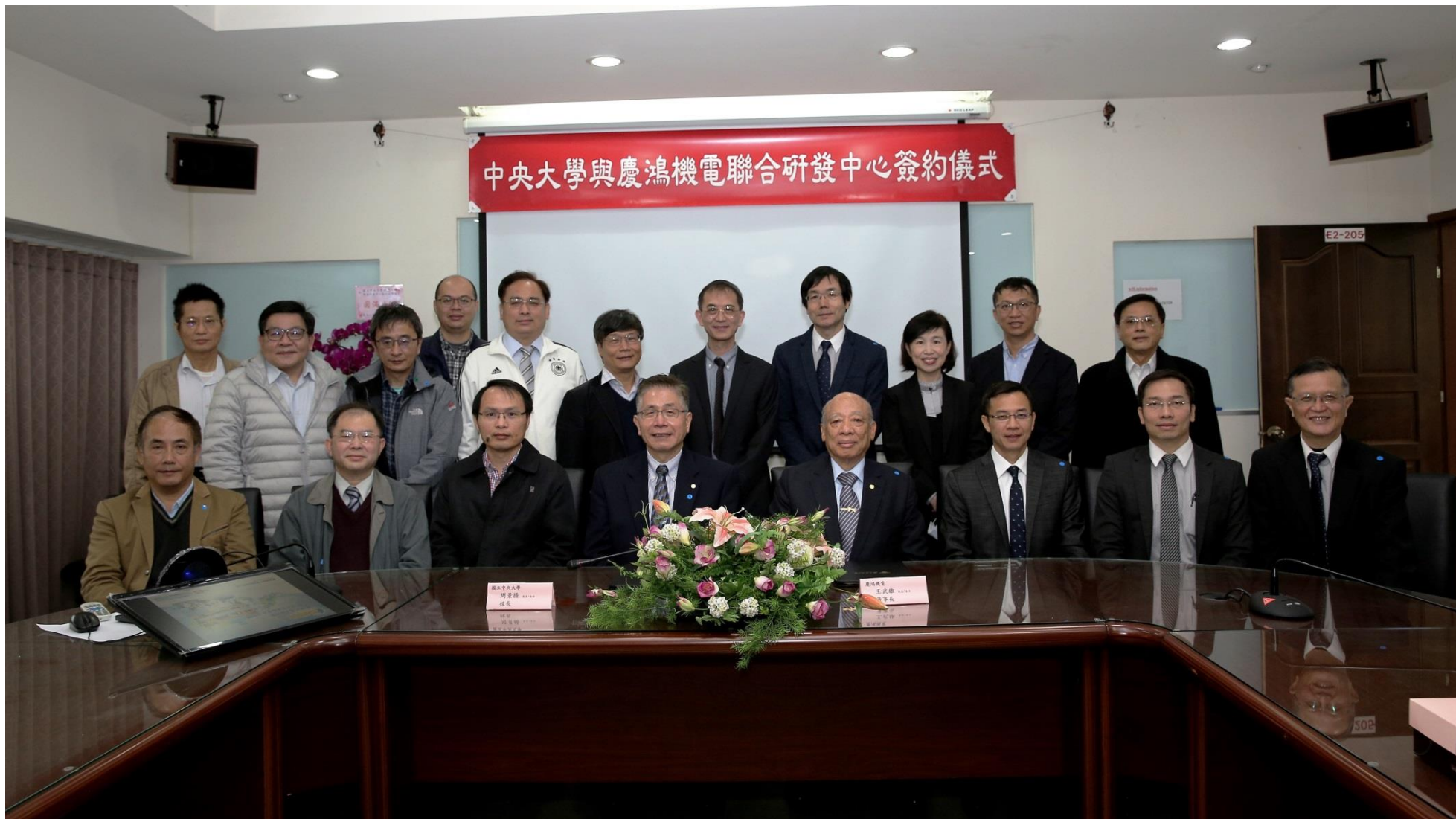
【圖 5】慶鴻機電與中央大學成立聯合研發中心，雙方團隊共襄盛舉，一同合影留下美好見證。