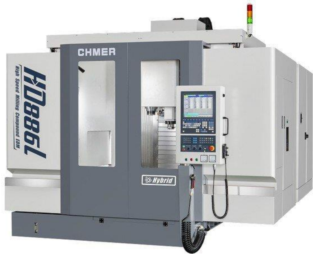
圖：慶鴻機電率先發表全球首部商品化的高速銑削放電複合加工機，使用舜鵬科技自主開發的五軸同步 CNC 控制器硬軟體和高推力線性馬達，榮獲 2020 年台灣精品獎銀質獎。

並支援慶鴻機電在 2019 年 TIMTOS 率先發表全球首部商品化的高速銑削放電複合加工機，使用舜鵬科技自主開發的五軸同步 CNC 控制器硬軟體和高推力線性馬達，並搭載永磁同步主軸(PMSM)、高解析度光學尺進行全閉迴路伺服控制，因為雙主軸採取氣壓平衡裝置，得以實現高反應性和精度定位，大幅提升加工精度和使用壽命；甚至加裝 A/C 搖籃式四五軸，還可用來加工航太、LED 模具、醫材所需的複雜或曲面工件。